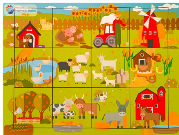
Πίστα: Το χωριό μου